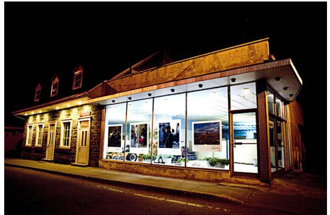
Technomades, Nuit blanche, Montréal, 2009,