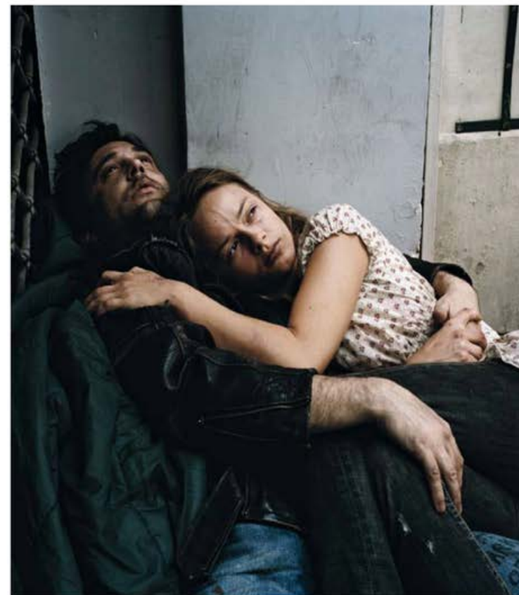
Christophe Beaugard Semantic Tramps , 2008 à gauche, vue de l'exposition

Inventer la présence , François Saint-Pierre.