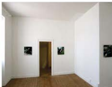
Eric Baudelaire The Dreadful Details , 2007 vue du diptyque

Pointer une crise de la représentation, introduire une distance critique sur les images qu'on nous donne à voir est aussi le propos de Christophe Beaugard dans Semantic Tramps , série de douze portraits de sans-abri. Les personnes qui figurent en gros plan dans ces images riches en détail, de format 60 x 60 cm, sont en fait des acteurs professionnels. « [Le] choix artistique et existentiel [de Beaugard], impératif en tout cas, l'a amené à se saisir de cette question actuelle en refusant de photographier les sujets de sa recherche. Pour lui, les sans visage et sans domicile, les sans voix et sans moyens "ne se photographient pas". [...] En général, pourtant, chacun fait confiance à la photo comme si elle faisait preuve, alors qu'elle ne fait preuve que du regard patient ou fou du photographe. En outre, l'image est devenue, faut-il le rappeler, éminemment saturante depuis quelques années, et son réalisme pose bien des problèmes d'accoutumance. À force de visiblement et crûment photographier l'horreur (massacres, pauvreté, exécutions, morts, guerres), celle-ci devient invisible, décor traditionnel d'un monde hédoniste et individualiste, plus enclin à regarder Britney Spears que les exclus du canal Saint-Martin. » 5