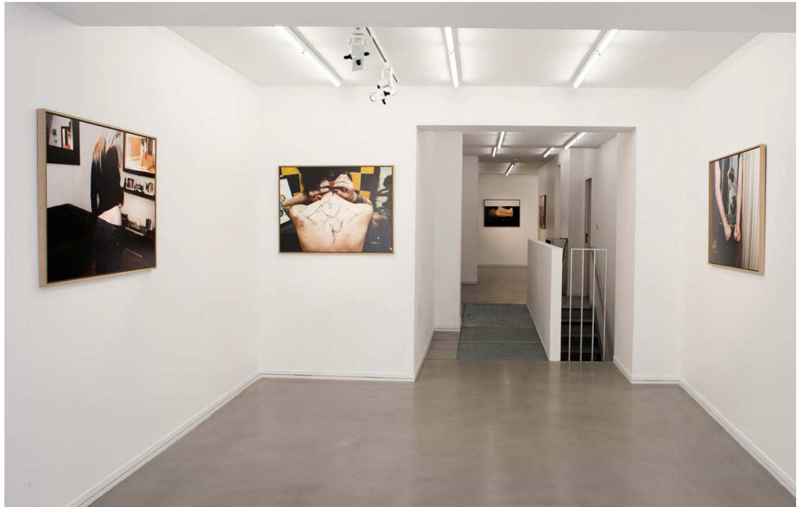
Pentimento, Galerie Briobox, Paris, 2011