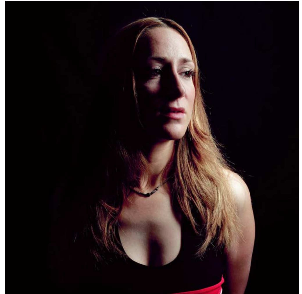
Muriel, Chirurgies, 2004

Dans ces images tout se joue dans le cadre qui fonctionne comme un piège à regard. Je parle de chirurgie mais on ne voit rien.